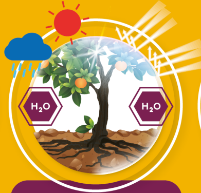
ลดความเครียดให้พืช