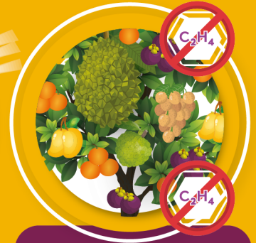
ลดการหลุดร่วงและช่วยให้การสุกแก่เสมอกัน