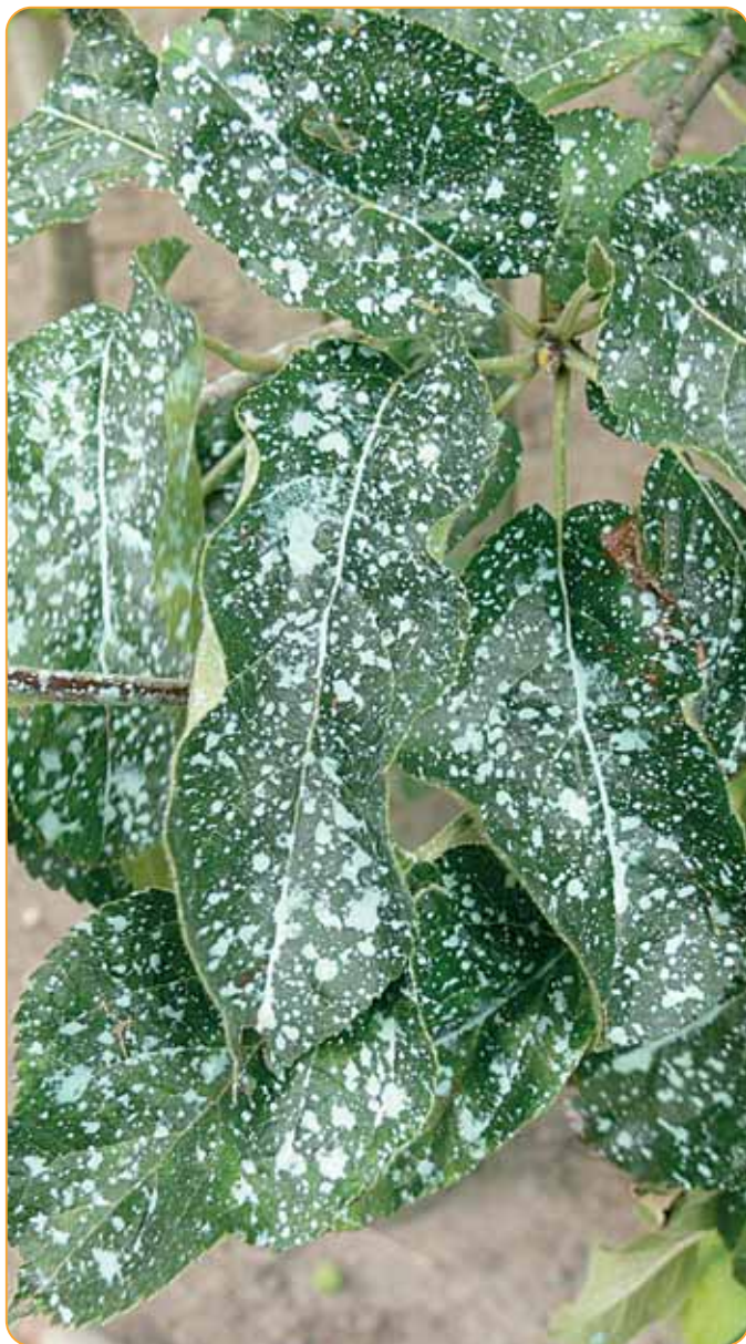
aplikácia sólo mednatého prípravku v jablaniach