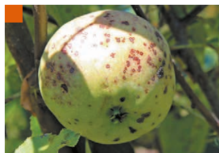
Симптомы парши на плодах