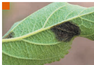
Симптомы парши на листьях яблони