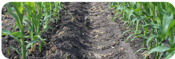
Rozwiązanie oparte na Sulcotrek 500 SC