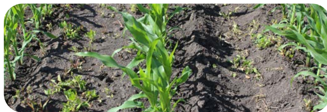
Standard rynkowy 1,5 l/ha

Doświadczenie – woj. dolnośląskie, 2017.