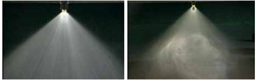
Herbicidas + Grounded, 200 l/ha, slėgis 2 barai | Vien herbicidas, 200 l/ha, slėgis 2 barai