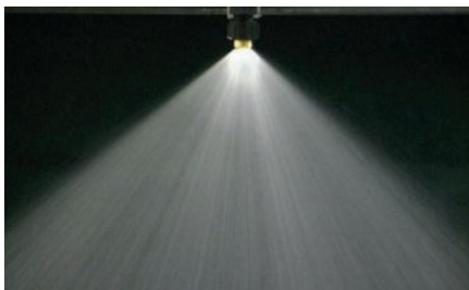
Herbitsiid + GROUND ® , 200 l/ha, rõhk 2 baari