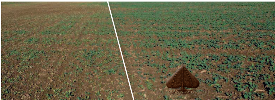
GROUND ® vähendab oluliselt rapsi lehtede valgenemist liiga suure klomasooni sisalduse kasutamise korral.

Pärast GROUND ® kasutamist on võimalik kasvatada kõiki taimi ilma piiranguteta. Arvestada tuleb kasutatud herbitsiidi võimalike piirangutega.