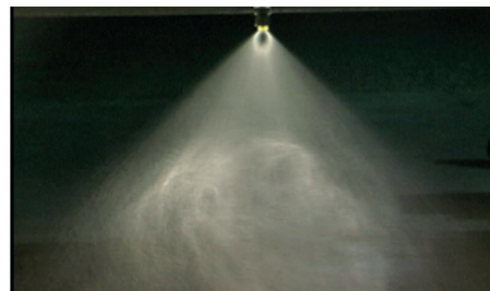
Ainult herbitsiid, 200 l/ha, rõhk 2 baari